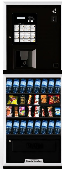
LEI300 SMART + ARIA S SLAVE